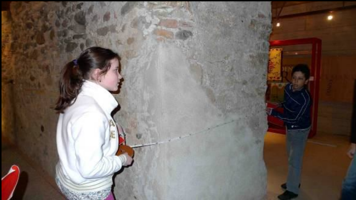
... ma quanto era grosso? Lo spessore delle mura fortificate era ben di 1,35 metri!