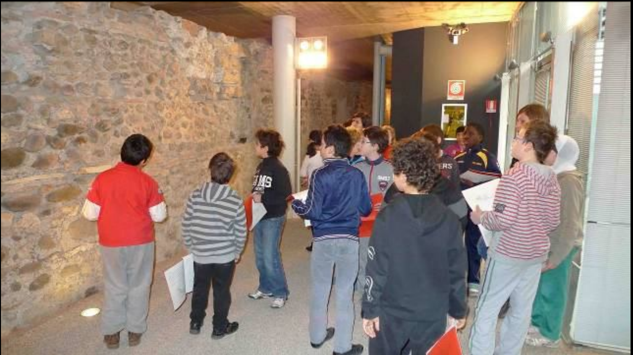
Si vede ancora il lungo tratto del muro di cinta orientale (circa 40 metri)