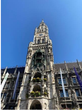
Il Glockenspiel di Marineplatz

In Baviera si possono fare molti sport e passeggiate.