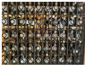
I boccali di birra dei clienti della birreria HB..