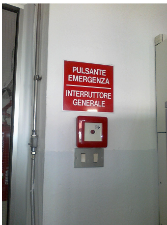
Foto 1: pulsante di sgancio elettrico posto nell'atrio di ingresso