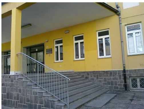
Foto 2: ingresso per studenti e personale scolastico da Via al Torrione

L'ingresso principale per gli studenti e il personale scolastico avviene da Via Torrione.